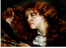
La belle Irlandaise

A Ornans je suis, Je suis incertain, Un certain complice, Qu'on plisse et compresse, Qu'on presse de penser, De penser l'enjeu, A l'enjeu de mots, De mots sur des notes, Notes sur des cool heures, Couleurs de mystère De Mister NEWHALF, NEWHALF le pseudo, Pseudo vu de face, De faces et attrapes, Attrap'toi au pinceau ! Pinceau de Courbet, Courbé je te suis, Je suis la musique, Musique à Ornans,